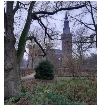
Slot Moyland – 6 december 2020

Op 18 februari vertrekt het regiment richting het Moyland bos. Midden in de nacht nemen ze hun posities in en voor de komende 48 uur patrouilleren ze, vinden er wat schermutselingen plaats met Duitse soldaten en beschieten ze Slot Moyland.